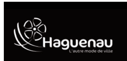
version standard blanc

Le logo doit toujours être utilisé intégralement (fleur+nom+ signature ) sauf si sa taille ne le permet pas (signature illisible car trop petite).