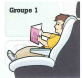
siège à réceptacle